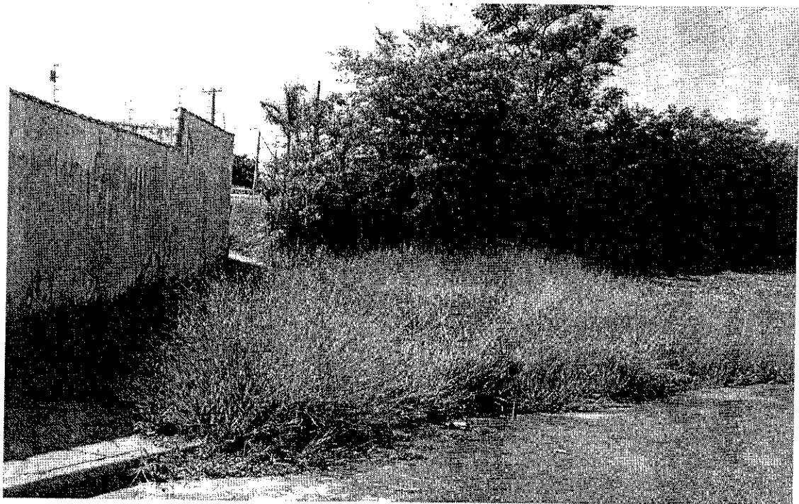
Terreno serve de esconderijo e rota de fuga