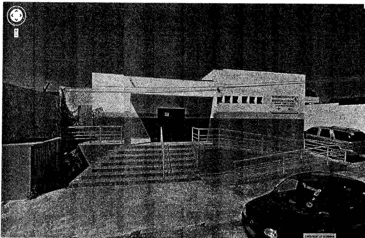
FACHADA DO PRÉDIO DA UNIDADE SAÚDE DA FAMÍLIA – TRIÂNGULO ATUALMENTE SEM GRADE DE PROTEÇÃO