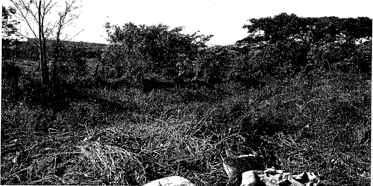
CÓRREGO LOCALIZADO NA RUA RAUL BORGES – BETA LD DIREITO DO CÓRREGO