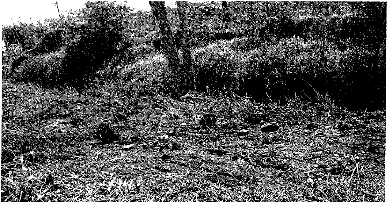
CÓRREGO LOCALIZADO NA RUA RAUL BORGES – BETA LD ESQUERDO DO CÓRREGO