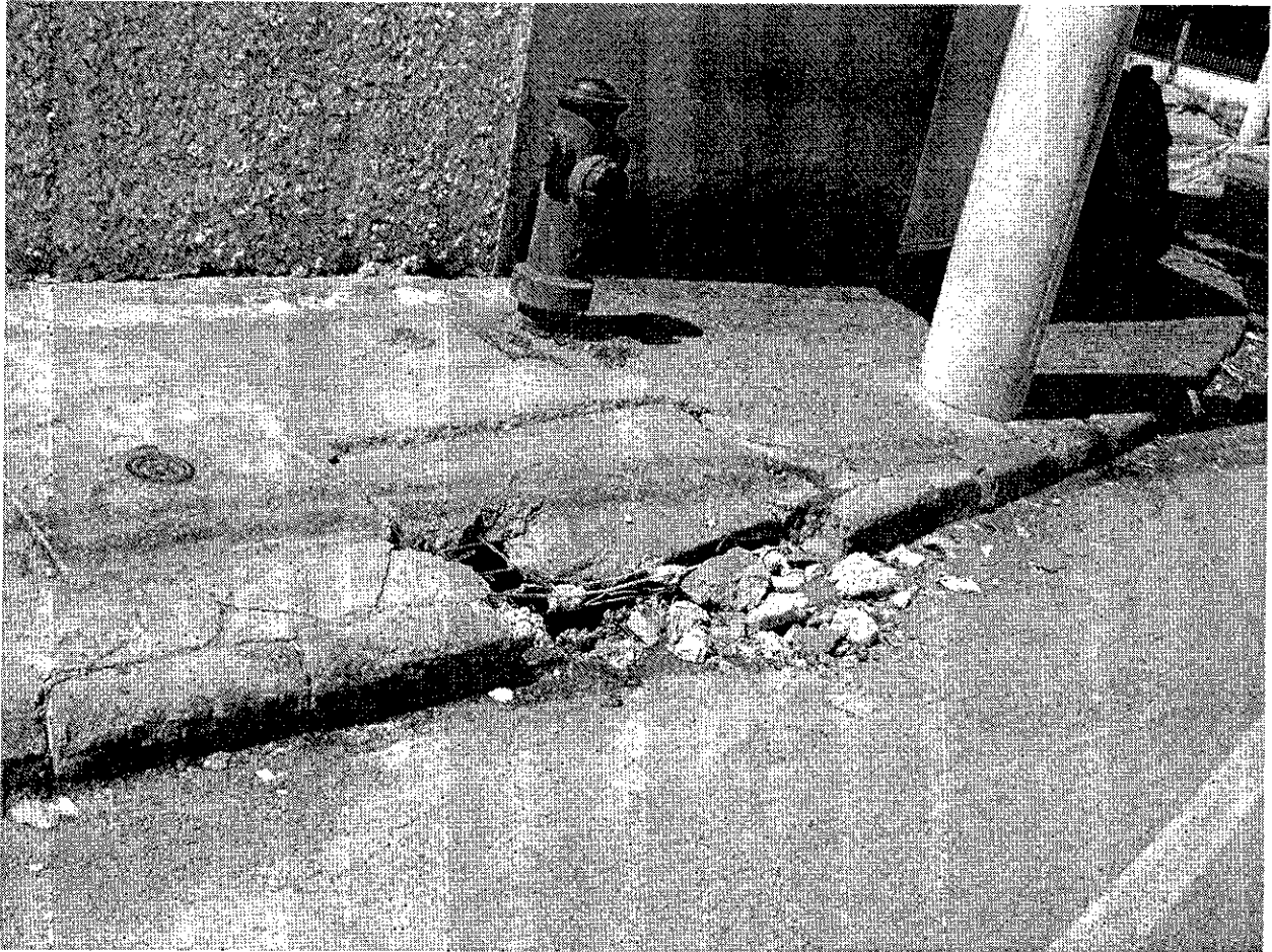
Av. José Francisco da Silva, 2810, bairro Feital