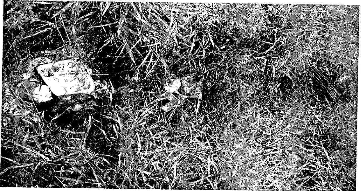
- Valeta com acúmulo de água e lixo.

Rua São Bento do Sapucaí, próximo ao número 597, bairro Alto do Cardoso.