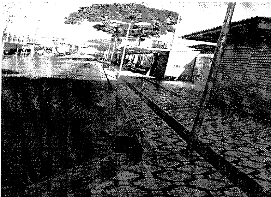
Vista do Calçamento da Rua Rubião Junior- Centro Cadeirantes, requerem rampas de acessibilidade