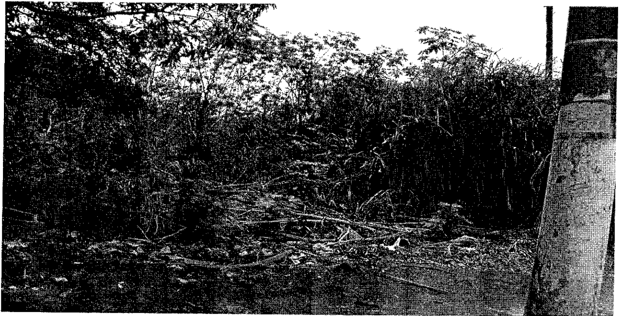
Detalhe: falta calçada e limpeza do mato, visando dar maior segurança aos usuários do transporte coletivo.