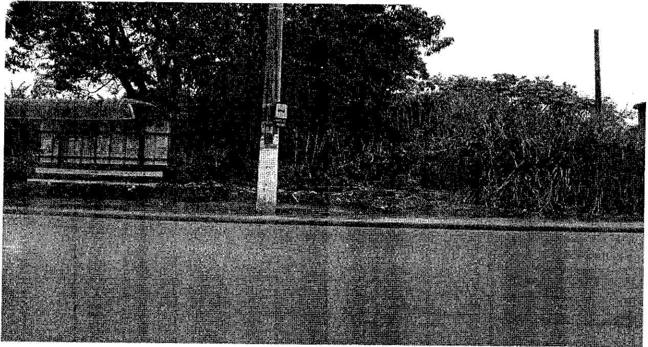
Ponto de ônibus localizado na Avenida João Francisco da Silva, em frente ao nº 2840, Feital.