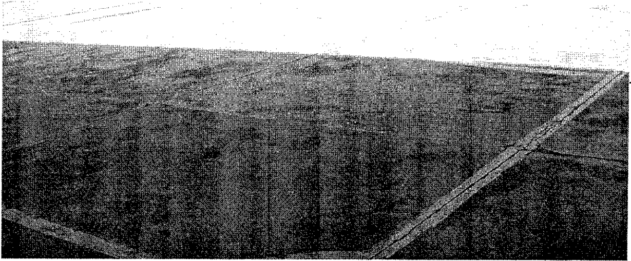
-Piso da quadra precisa de reparos e pintura