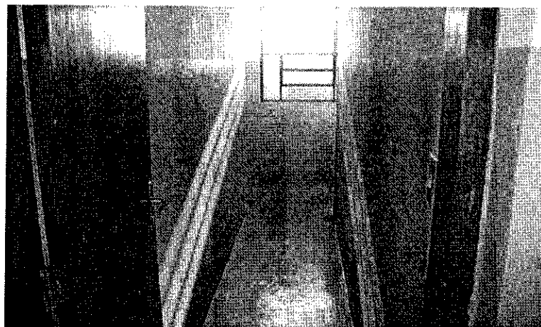
5- Corredor estreito