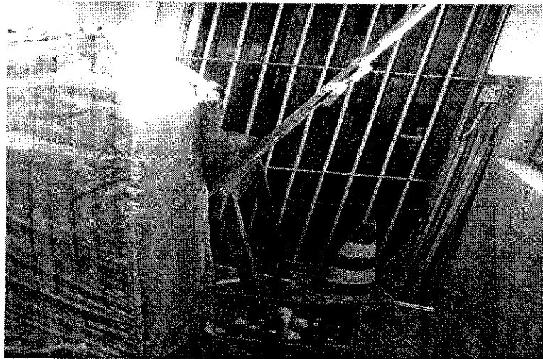
4- Local utilizado para guardar material – pouco espaço