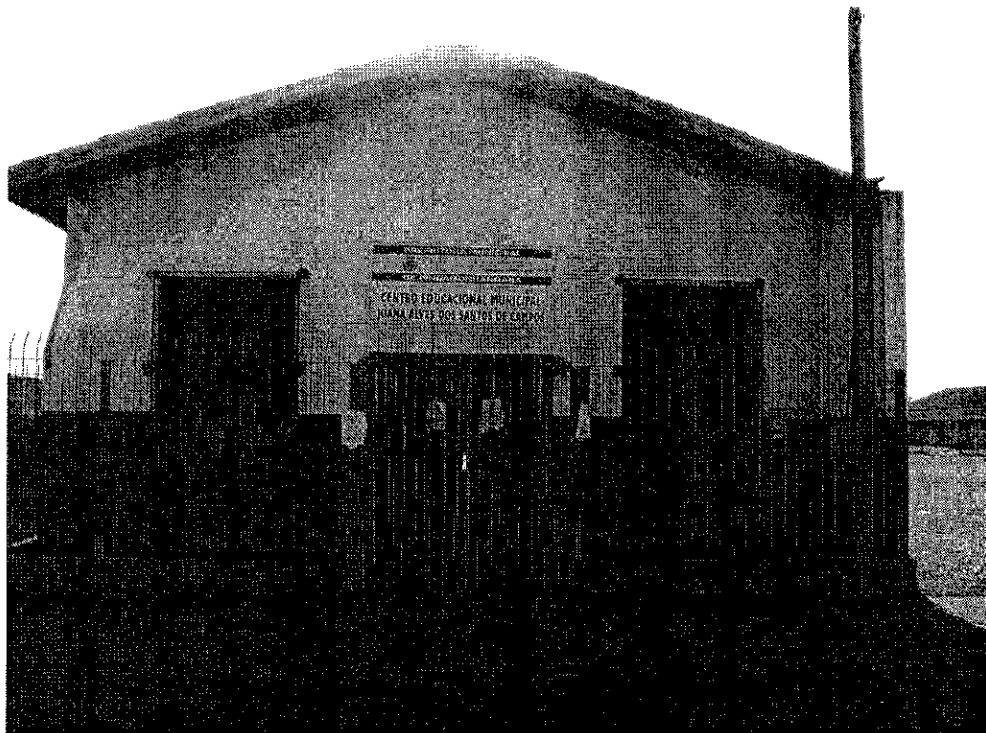
1- Fachada do prédio