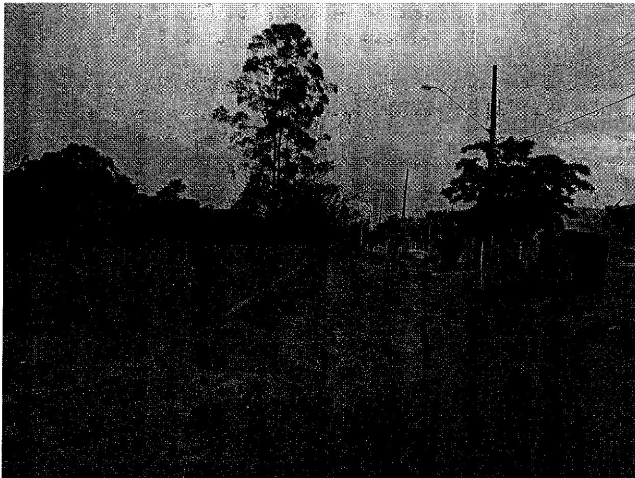
RUA EGIDIO RABELO NETO – BAIRRO MANTIQUEIRA