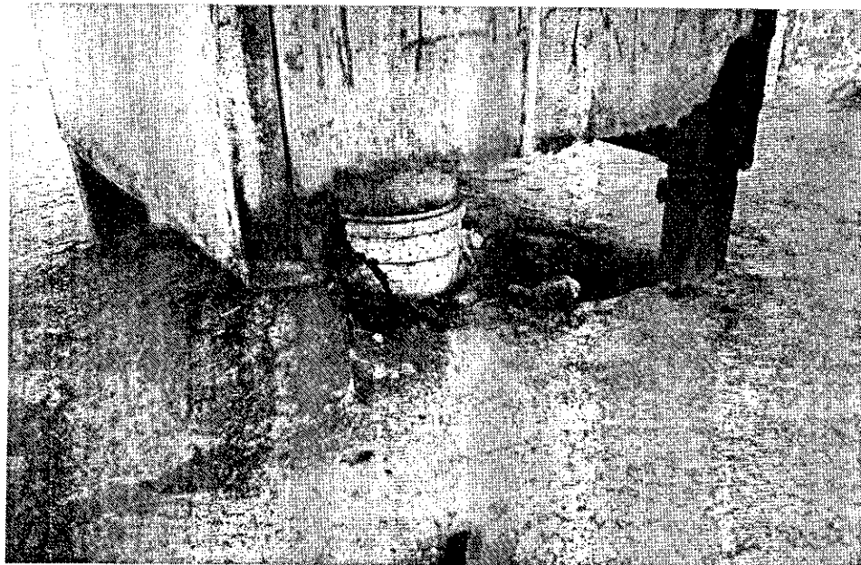
BASE DO PONTO ENFERRUJADO