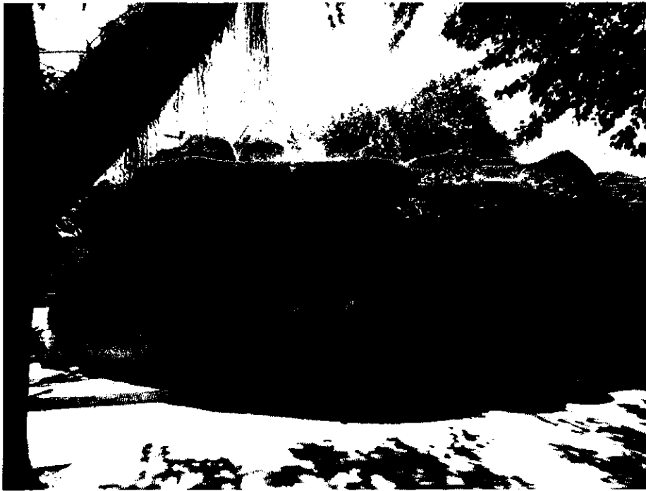
papelão depositado na gruta da Cascata