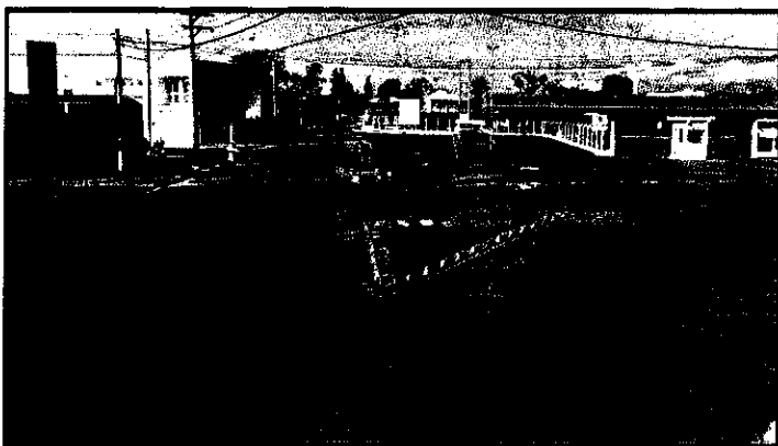
Antes do recapeamento