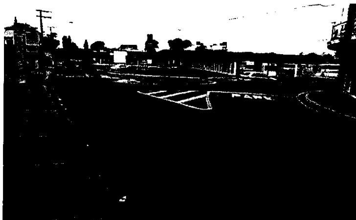
Depois do recapeamento

Plenário Dr. Francisco Romano de Oliveira, 22 de outubro de 2012.