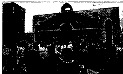
Inauguração da Igreja das Taipas foi no dia 17 de novembro