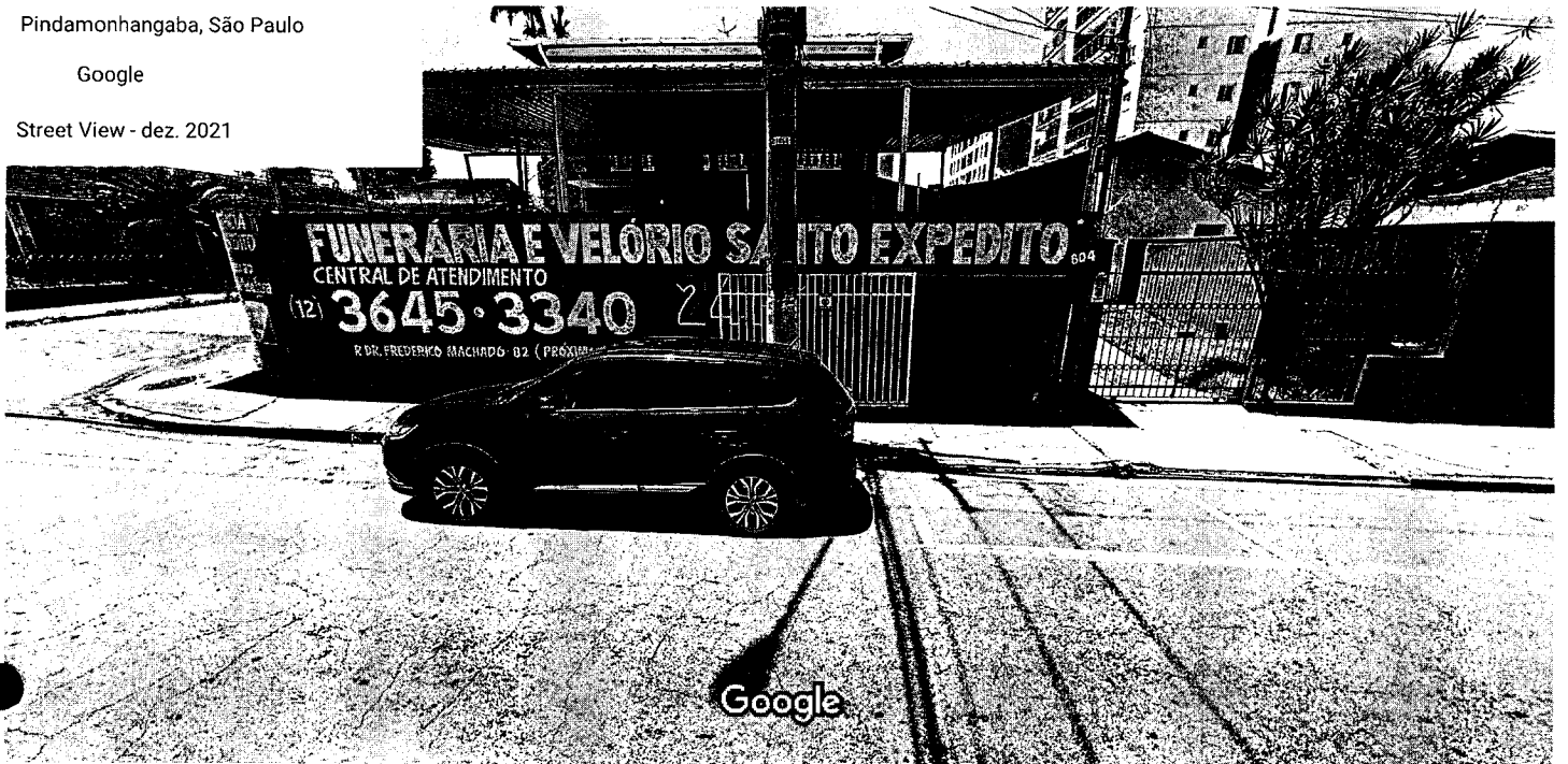
Captura da imagem: dez. 2021