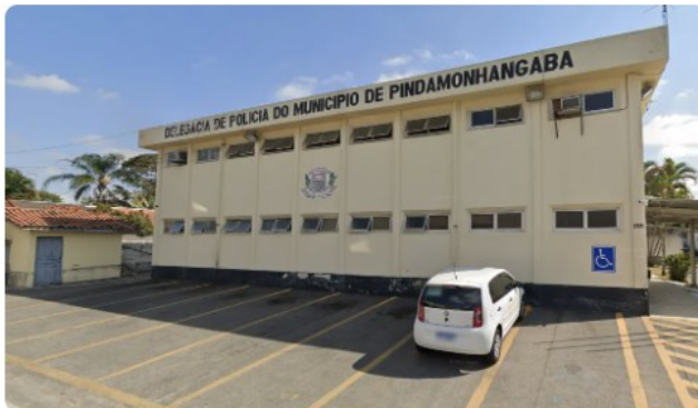
O caso foi registrado na delegacia de Pindamonhangaba (SP)

Um homem de 38 anos foi morto a tiro dentro da própria casa em Pindamonhangaba , no interior de São Paulo, na noite deste domingo (22).