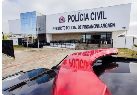
2º DP 2 DP Pindamonhangaba

Um homem foi encontrado morto, na manhã desta sexta-feira (6), em um lixão em Pindamonhangaba (SP) . A vítima estava em estágio avançado de decomposição e ainda não foi identificada.