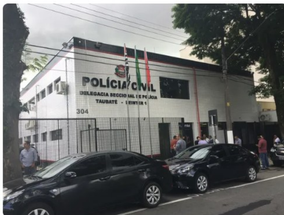
O caso foi registrado na delegacia seccional de Taubaté

Um jovem de 20 anos foi morto a tiros na noite desta sexta-feira (11) em Pindamonhangaba (SP) . Ele foi atingido por seis tiros nas costas e morreu antes da chegada do socorro. Ninguém foi preso.